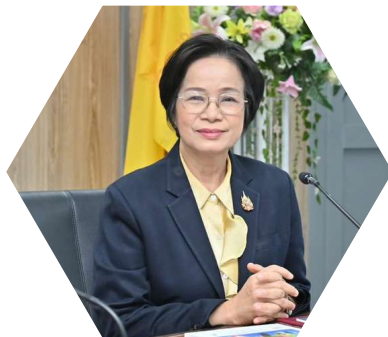
นางอภิญญา ชมภูมาศ อธิบดีกรมกิจการเด็กและเยาวชน