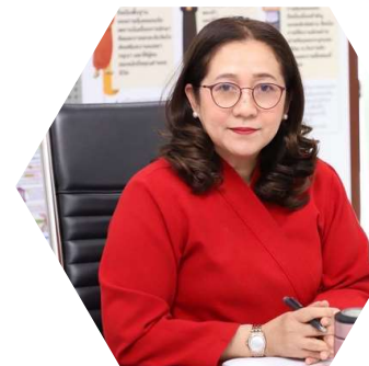
นางภิญญา จำรูญศาสน์ รองอธิบดีกรมกิจการเด็กและเยาวชน